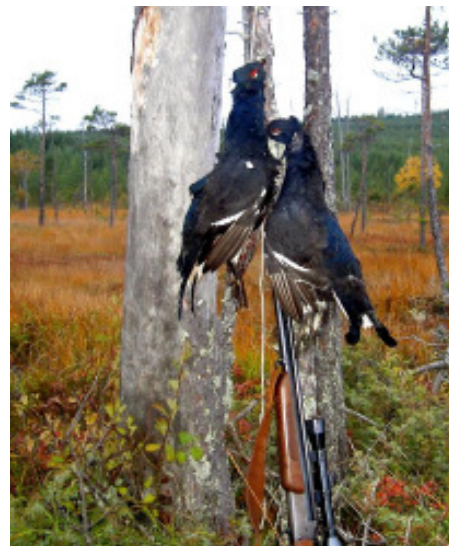
Hösten är också jaktens tid

Ett signum för Orsa Besparingsskog är våra välskötta skogar. Många skickliga skogsmän har genom åren satt sin prägel på skogarna. Vi kommer fortsatt att ha en hög skogsvårdsambition både vad gäller förnygring och gallring. Ett led i den satsningen är att fortsätta att utveckla plantskolan, bra plantkvalitet lägger grunden för våra framtida skogar. Då den nya organisationen sjsätts kommer vi att göra en rejäl utbildningssatsning som skall omfatta samtlig personal. Vi vill öka personalens delak-