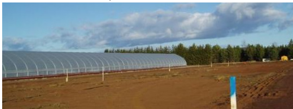
Nytt kallväxthus och grundläggning för den nya långnattsanläggningen

Efterfrågan på våra Starpot-plantor ökar stadigt, Tallhed har ett mycket gott rykte på plantmarknaden. Personalen på plantskolan gör ett berömvärdt jobb!