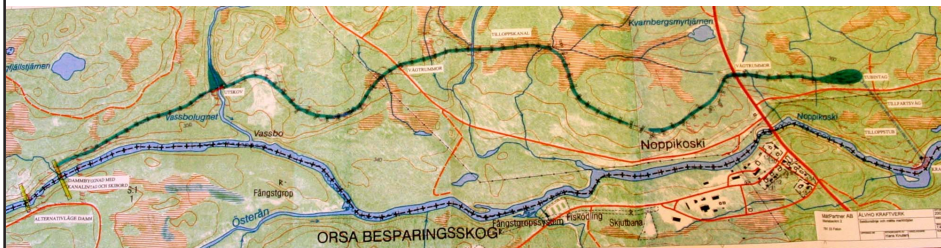
Vattnet avses att ledas i en kanal norr om Ore älv och under väg E45

Inom vårt samarbete med Fortum har vi också tagit upp vår vattendom om att bygga ett vattenkraftverk mellan Vässinkoski och Noppikoski. Gällande vattendom anger att vattnet skall föras fram i en 3 km sprängd tunnel fram till kraftstationen vid Noppijärvi. Nu söker vi ny lösning där vattnet leds fram i en 3,5 km lång kanal norr om Ore Älv. Kraftstationen är planerad för en effekt på 4,5 MW och en årlig medelproduktion på 15 GWh.