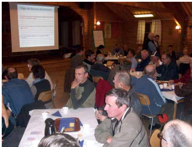
Från seminariet på Orsa Hembygdsgränd